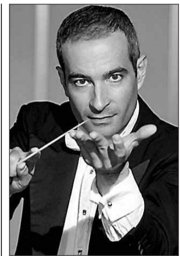
• Antonello Manacorda

Aan zijn benoeming gingen vier gastdirecties bij het Gelders Orkest vooraf. Zijn Arnhemse debuut dateert van 2009. Manacorda begon als violist en studeerde onder meer bij Herman Krebbers in Amsterdam. In 1997 richtte hij met Claudio Abbado het Mahler Chamber Orchestra op, waaraan hij als concertmeester was verbonden. In 2002 besloot Manacorda zich op het dirigeren toe te leggen. Vorig jaar werd hij al benoemd tot chef-dirigent van de Kammerakademie Potsdam.